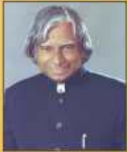
డా॥ ఎపిజి అబ్దుల్ కలాం భారతదేశపు మాజీ రాష్ట్రపతి

"i Watch" భారత దేశం యొక్క సరివర్తన కోసం పౌరుల ఉద్యమాల ద్వారా సృష్టించబడిందని తెలుసుకునేందుకు నేను ఆనందపడుతున్నాను.