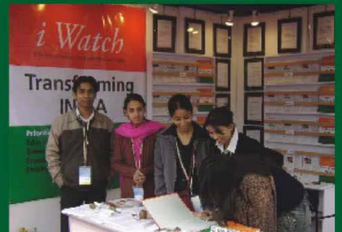
Pravasi Bhartiya Divas, New Delhi, India