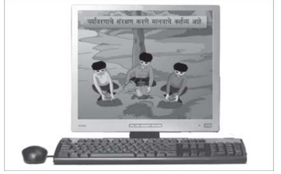
కంప్యూటర్ మరియు లాప్టాప్

E-క్లాసు పెన్ డ్రైవ్ ను E-బాక్స్ కు కలిపి, పాఠాన్ని నేరుగా టీవీపై చూడవచ్చు