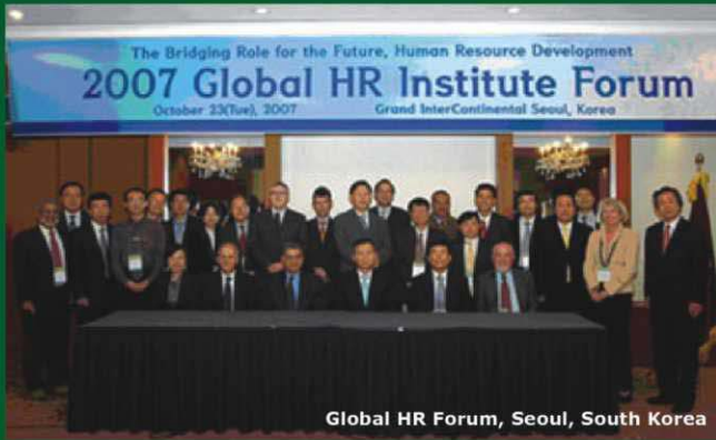
Global HR Forum, Seoul, South Korea