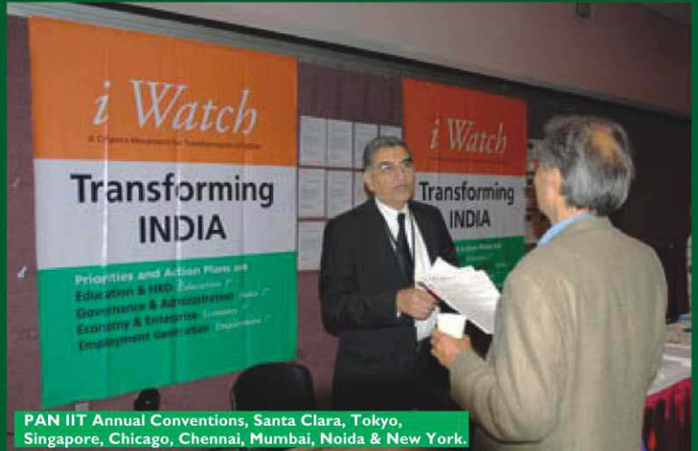
PAN IIT Annual Conventions, Santa Clara, Tokyo, Singapore, Chicago, Chennai, Mumbai, Noida & New York.